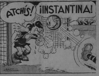
Cuando Ud. oiga estornudar, diga "Instantánea", en lugar de "Salud!", porque Instantánea significa Salud cuando una persona comienza a resfriarse...