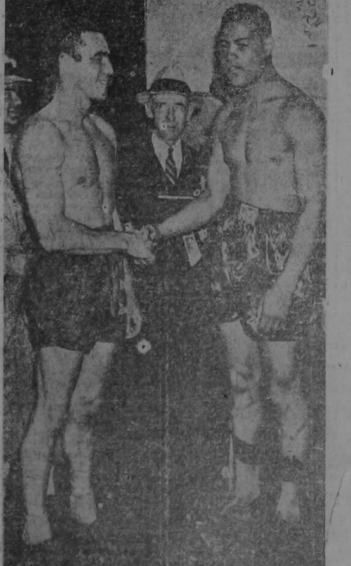
Baer y Louis se saludan cordialmente horas antes de la pelea en la sala de prensa de la Comisión de Boxeo del Estado de Nueva York. Ambos fueron encontrados en condiciones físicas por los doctores que hicieron los exámenes de rigor.

BAER Y LOUIS SE SALUDAN CORDIALMENTE, HORAS ANTES DE LA PELEA